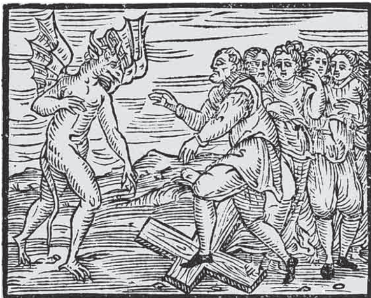
Ο διάβολος και οι μάγισσες ποδοπατούν ένα σταυρό. Από το εγχειρίδιο κυνηγών μαγισσών, Compendium maleficarum , 1608.

Οι δίκες και οι εκτελέσεις, στην αγχόνη ή στην πυρά, ήταν δημόσιες εκδηλώσεις όπου όλη η κοινότητα ήταν υποχρεωμένη να παραβρεθεί, συμπεριλαμβανομένων των θυγατέρων των μαγισσών, πράγμα στο οποίο δινόταν ορισμένες φορές ιδιαίτερη σημασία. Οι κυνηγοί των μαγισσών έφταναν στην πόλη μαζί με γιατρούς, κρατικούς υπαλλήλους, μέλη του κλήρου και δήμιους. Όλοι οι κάτοικοι έπρεπε να πάνε στην πλατεία για να παρακολουθήσουν το θέαμα της δίκης, μια μεγάλη εκδήλωση με αποκορύφωμα τις εκτελέσεις. Αν κάποιος δεν παρευρισκόταν στην «εκδήλωση» ή αν, ακόμα χειρότερα, μιλούσε εναντίον της δίκης ή υπερασπιζόταν κάποια κατηγορούμενη θεωρούνταν αμέσως ότι αποδεχόταν την ενοχή του και η ζωή του έμπαινε σε κίνδυνο. Ο αυξανόμενος φόβος δεν μπορεί να θεωρηθεί υπερβολικός αν σκεφτεί κανείς ότι για δεκάδες χρόνια καίγονταν τακτικά πλήθη γυναικών. Οι άνθρωποι αυτοί ήταν γείτονες, φίλοι και συγγενείς. Τα περιστατικά γειτόνων που κατηγορούσαν ο ένας τον άλλο δεν ήταν παρά αντίδραση απέναντι στο φόβο που γεννούσαν αυτές οι επαναλαμβανόμενες δημόσιες δίκες και εκτελέσεις. Αυτή είναι μια διαφορετική ανάγνωση της ιστορίας σε σχέση με την εξήγηση περί «μανίας κατά των μαγισσών» ή περί «μαζικής ψύχωσης» που δίνεται συχνά στην επίσημη ιστορία. Στη συνέχεια εξετάζονται κάποιες από τις αιτίες και τις συνέπειες του κυνηγιού των μαγισσών.