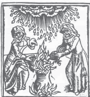
Μάγισσες που με ζόρκια προκαλούν βροχή, 1489.

«Η συνεργασία μεταξύ Εκκλησίας, Κράτους και ιατρικού επαγγέλματος γνώρισε την πλήρη της άνθιση με τις δίκες των μαγισσών. Ο γιατρός παρουσιάζοταν ως ο 'ειδήμων' της ιατρικής, προσδίδοντας μια επιστημονική αύρα στην όλη διαδικασία. Του ζητούσαν να κρίνει εάν κάποιες συγκεκριμένες γυναίκες ήταν μάγισσες και εάν κάποιες ασθένειες είχαν προκληθεί από μαγεία. Στο κυνήγι των μαγισσών, η Εκκλησία νομιμοποίησε ρητώς τον επαγγελματισμό των γιατρών, απορρίπτοντας τη μη-επαγγελματική θεραπεία ως αιρετική: 'Αν μια γυναίκα τολμήσει να θεραπεύσει χωρίς να έχει σπουδάσει, τότε είναι μάγισσα και πρέπει να πεθάνει'. Η διάκριση μεταξύ 'γυναικείας' δεισιδαιμονίας και 'ανδρικής' ιατρικής οριστικοποιήθηκε με τους ρόλους του γιατρού και της μάγισσας στις δίκες... Εκείνος τοποθετήθηκε στην πλευρά του Θεού και του Νόμου, ένας επαγγελματίας ίσης αξίας με τους δικηγόρους και τους θεολόγους, ενώ εκείνη τοποθετήθηκε στην πλευρά του σκότους, του κακού και της μαγείας. Ο γιατρός όφειλε το νέο του κύρος όχι στα ιατρικά ή τα επιστημονικά του επιτεύγματα, αλλά στην Εκκλησία και το Κράτος που τόσο καλά υπηρέτούσε... Το κυνήγι των μαγισσών δεν εξάλειψε τις θεραπεύτριες των κατώτερων τάξεων, αλλά τις στιγματίσε για πάντα ως δεισιδαίμονες και πιθανώς κακόβουλες».