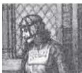
"Στρίγγλα" με χαλινάρι, 1885.

Αναφερόμενη τόσο στον τρόπο που οι αρχές ενθάρρυναν τον αποκλεισμό των γυναικών από τη μισθωτή εργασία όσο και στην οικιακή χειροτεχνική και βιοτεχνική εργασία που έκαναν πράγματι οι γυναίκες, η Silvia Federici εξηγεί: «Αυτή η συμμαχία μεταξύ των συντεχνιών και των αρχών των πόλεων, καθώς και η διαρκής ιδιωτικοποίηση της γης ήταν που επέβαλαν ένα νέο έμφυλο καταμερισμό της εργασίας, ορίζοντας τις γυναίκες ως μητέρες, συζύγους, κόρες, χήρες –όροι που απέκρυπταν την ιδιότητά τους ως εργάτριες– ενώ συγχρόνως έδινε στους άνδρες ελεύθερη πρόσβαση στο σώμα και την εργασία των γυναικών καθώς και στο σώμα και την εργασία των παιδιών τους». 13 Η Silvia Federici ισχυρίζεται ότι ο καταμερισμός της εργασίας βάσει του φύλου ήταν μια σχέση εξουσίας που αποτέλεσε τον ακρογωνιαίο λίθο της διαδικασίας της πρωταρχικής συσσώρευσης και της ανάπτυξης του καπιταλισμού. Το κυνήγι των μαγισσών υπήρξε αρωγός της πολιτιστικής και οικονομικής καταπίεσης με τη διαρκή απειλή της εκτέλεσης όσων δε συμμορφώνονταν.