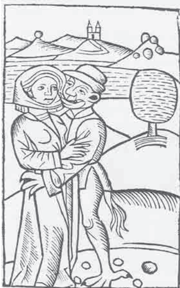
Ο διάβολος αποπλανεί μια γυναίκα, 1489.

Μερικά από τα πιο αλλόκοτα πράγματα που έχουν γραφτεί για τη γυναικεία σεξουαλικότητα υπάρχουν στο Malleus Maleficarum , στο οποίο περιλαμβάνονται αποσπάσματα όπως: «Τι να πει κανείς για αυτές τις μάγισσες που μαζεύουν μεγάλες ποσότητες ανδρικών οργάνων και τα βάζουν στη φωλιά ενός πουλιού ή τα κλείνουν σε κάποιο κουτί όπου αυτά κινούνται μόνα τους σαν ζωντανά μέλη και τρώνε βρώμη και καλαμπόκι, κάτι που πολλοί έχουν δει και είναι συχνό θέμα μαρτυριών;» Ή «Πηγή της μαγείας είναι η σαρκική επιθυμία, που στις γυναίκες είναι ακόρεστη». 15