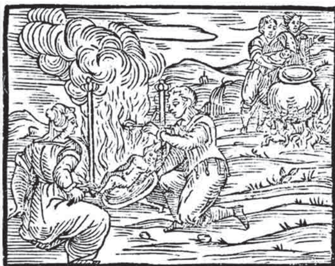
Μάγισσες που μαγειρεύουν παιδιά, Compendium maleficarum , 1608.

γεννήσεων. Σήμερα, η μη καταχώρηση μιας γέννησης είναι παράνομη σε όλη σχεδόν την Ευρώπη. Υπάρχει σημαντικός έλεγχος της αναπαραγωγής από τις αρχές, που κυμαίνεται από την απαγόρευση της αντιουίλληψης και των αμβλώσεων έως τα κρατικά προγράμματα ελέγχου γεννήσεων στην Κίνα κι από την επιβεβλημένη στείρωση σε κάποιες βιομηχανικές ζώνες εξαγωγών, μέχρι την άμβλωση θηλυκών εμβρύων στην πατριαρχική κοινωνία της Ινδίας. Ο βαθμός ιατροκοποίησης της γέννας και η αντιμετώπισή της με όρους επικινδυνότητας, καθώς και η πίστη που έχουμε στις δυνάμεις των γιατρών και των νοσοκομείων που μοιάζουν μαγικές (παρά τη συχνή μας απογοήτευση από το ιατρικό κατεστημένο), αποτελούν ακόμη και σήμερα απόδειξη της μάχης αυτής. 25