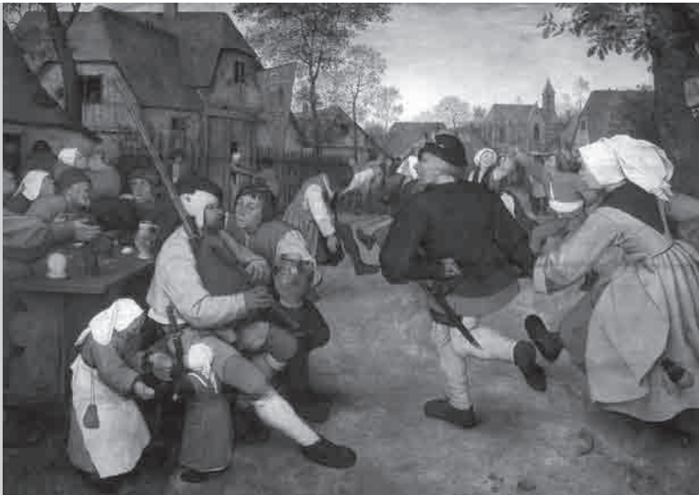
Pieter Bruegel, Ο Χορός των Χωρικών , 1568.

Μπορούμε να χρησιμοποιήσουμε τη γνώση αυτή για να γίνουμε δυνατότεροι στη μάχη ενάντια στη συνεχιζόμενη καταπίεση και να τιμήσουμε τις γυναίκες αυτές που, στο παρελθόν, παρέμειναν δυνατές και αντεπιτέθηκαν, καθώς κι εκείνες που κάνουν το ίδιο στο παρόν και θα κάνουν το ίδιο στο μέλλον.