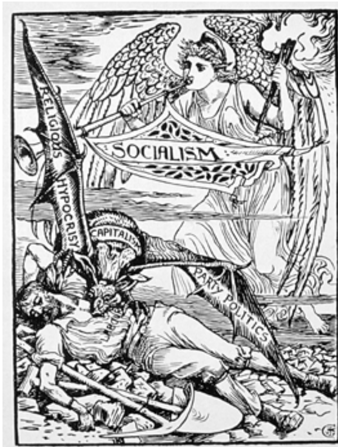
WALTER CRANE, "The Vampire", 1885.

Ο κοιμισμένος εργάτης, που απομιζείται από το βαμπίρ του καπιταλισμού, ετοιμάζεται να ξυπνήσει από την αγγελική φιγούρα του Σοσιαλισμού.