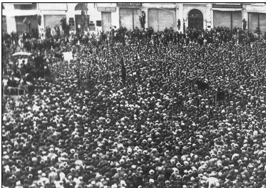
Κυριακή 10 Μάη. Ο λαός της Θεσσαλονίκης κηδεύει τα θύματα της εξέγερσης

Μετά τον πόλεμο φεύγει από την Ελλάδα ουσιαστικά σαν πρόσφυγας. Επιστρέφει στην δικτατορία και έκτοτε ζει στη Θεσσαλονίκη.