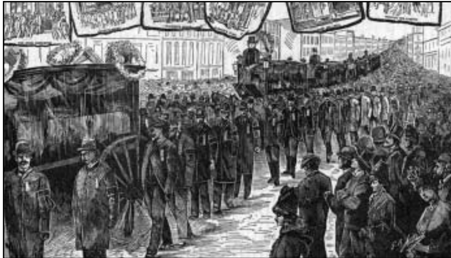
Επίκαιρη ξυλογραφία της κηδείας των τεσσάρων κρεμασμένων ανδρών

Στις 26 Ιουνίου 1893 ο κυβερνήτης Altgeld τους απελευθέρωσε. Ξεκαθάρισε ότι δεν έδωσε τη χάρη επειδή πίστευε ότι τα άτομα είχαν υποφέρει αρκετά, αλλά επειδή ήταν αθώα για το έγκλημα για το οποίο είχαν δικαστεί. Αυτοί και οι κρεμασμένοι ήταν τα