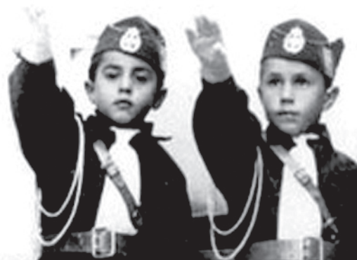
Ομοιόμορφη στολή και φασιστικός χαιρετισμός. Η Εθνική Οργάνωση Νεολαίας δείχνει ξεκάθαρα το ιδεολογικό στίγμα του μεταξικού καθεστώτος.

Ελλάδας-Ιταλίας κάθε άλλο παρά φιλικές μπορούν να χαρακτηριστούν. Η απειλή πολέμου ή η ανοιχτή κατάληψη εδαφών υπήρξε στο μενού της αντιπαράθεσης για να επιτευχθούν τα επιδιωκόμενα αποτελέσματα. Παραδείγματα τέτοιων αντιπαράθεσεων –που όμως αποσιωπούνται από τα επίσημα χείλη μιας και οι συσχετισμοί τώρα είναι διαφορετικοί- μπορούν να βρεθούν στην κατάληψη των Ιωαννίνων και της Κέρκυρας από τους Ιταλούς. Τα Ιωάννινα καταλήφθηκαν από τον Ιούνιο έως τον Σεπτέμβριο του 1917 για να πιεστεί η Ελλάδα να αναγνωρίσει τις ιταλικές επιδιώξεις κατά τα Συνέδρια της Ειρήνης που ακολούθησαν τον Α' παγκόσμιο πόλεμο και η Κέρκυρα καταλήφθηκε από τις 31-08 έως 27-09 του 1923 σε μια περίοδο που χαρασσότανε τα ελληνοαλβανικά σύνορα, που τόσο σημασία είχαν για τα ιταλικά συμφέροντα. Όλα αυτά εξηγούν περίφημα τους λόγους για τους οποίους η προσφυγή στα όπλα ήταν η μόνη επιλογή για τα δύο κράτη. Για να καταλάβουμε το μέγεθος της αντιπαράθεσης (αλλά και της κρατικής προπαγάνδας) οφείλουμε να αναδείξουμε ότι ο ελληνικός στρατός όχι μόνο αμύνθηκε κατά τον ελληνοϊταλικό πόλεμο, αλλά προσάρτησε και εδάφη επί της Αλβανίας δοθείσης της ευκαιρίας, άσχετα από το γεγονός ότι δεν κατάφερε τελικά να επισημοποιήσει τις κτήσεις του μετά το τέλος του Β' παγκοσμίου πολέμου.