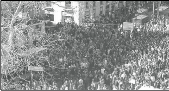
συνέχεια από τη σελίδα 1

χουν οδηγήσει στην ανάπτυξη ενός μαζικού κινήματος για τη μη-υλοποίησή του. Το κίνημα αυτό κατέβηκε στους δρόμους της πόλης με απίστευτη μαζικότητα (150.000 κόσμος σύμφωνα με την αστυνομία - έως και 400.000!) σύμφωνα με τους διοργανωτές.