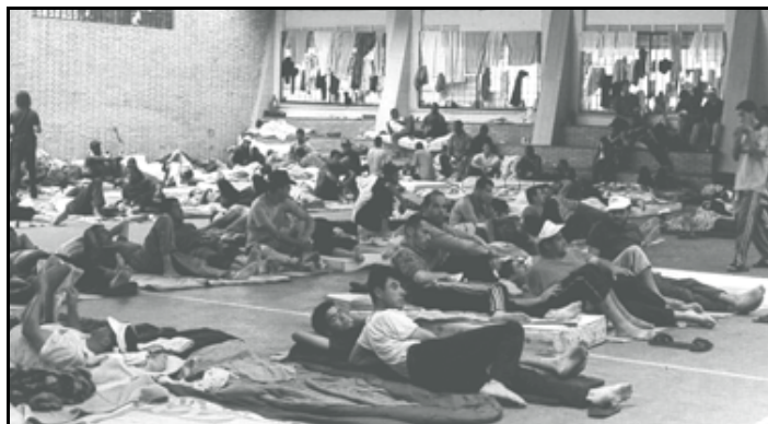
Συνεχίζουν την κατάληψη του Πανεπιστημίου οι μετανάστες στη Σεβίλλη