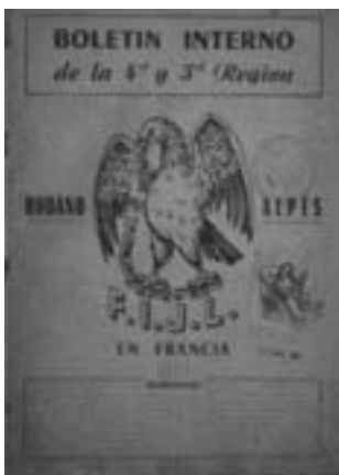
53. Εσωτερικό έντυπο της εξόριστης FIJL του Κλερμόν Φεράν, 1958.