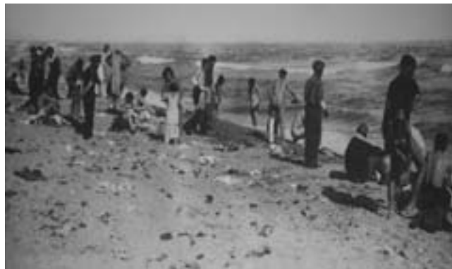
11. Φωτογραφία από το γαλλικό στρατόπεδο συγκέντρωσης προσφύγων στο Αρζελέ, στις 27/2/1939. Οι ανύπαρκτες υποδομές ανάγκασαν πάνω από 100.000 πρόσφυγες, που ζούσαν κλεισμένοι σε ελάχιστα στρέμματα παραλίας, να χρησιμοποιούν για την προσωπική τους υγιεινή τη θάλασσα.