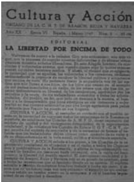
21. Η εφημερίδα Cultura y Acción, έντυπο της περιφερειακής επιτροπής Αραγόνας, Ναβάρρα και Ριόχα. Παράνομο φύλλο, Μάρτης του 1947.