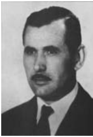
51. Ο Φρανσίσκο Σαμπατέ «Κίκο» (1915-1960), ο γνωστότερος αναρχικός ανάρτης της αντιφρανκικής αντίστασης, σε φωτογραφία του 1946. Δολοφονήθηκε σε συμπλοκή στο Σαν Σελόνι στις 5/1/1960.