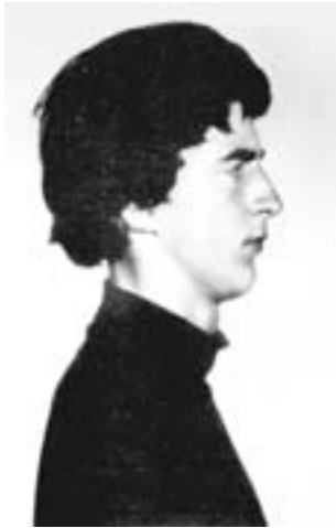
65. Ο Στιούαρτ Κρίστι (1946), γνωστός σκωτσέζος αναρχικός, στη φωτογραφία της σύλληψής του, το 1964, στη Μαδρίτη. Μετά την αποφυλάκισή του το 1967, ο Κρίστι συμμετείχε στην ίδρυση του Αναρχικού Μαύρου Σταυρού και στην Οργανωμένη Ταξιαρχία.