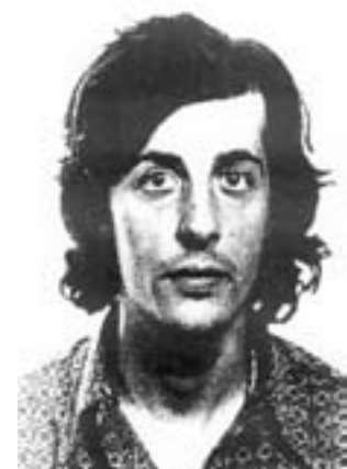
70. Ο Σαλβαδór Πουτς Αντίκ (1948-1974), μέλος του MIL που εκτελέστηκε στην γκαρότα, κατηγορούμενος για τη δολοφονία ενός μπάτσου και για ληστείες τραπεζών.