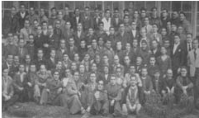
9. Φυλακισμένοι ελευθεριακοί στη φυλακή του Μπούργος, 1942.